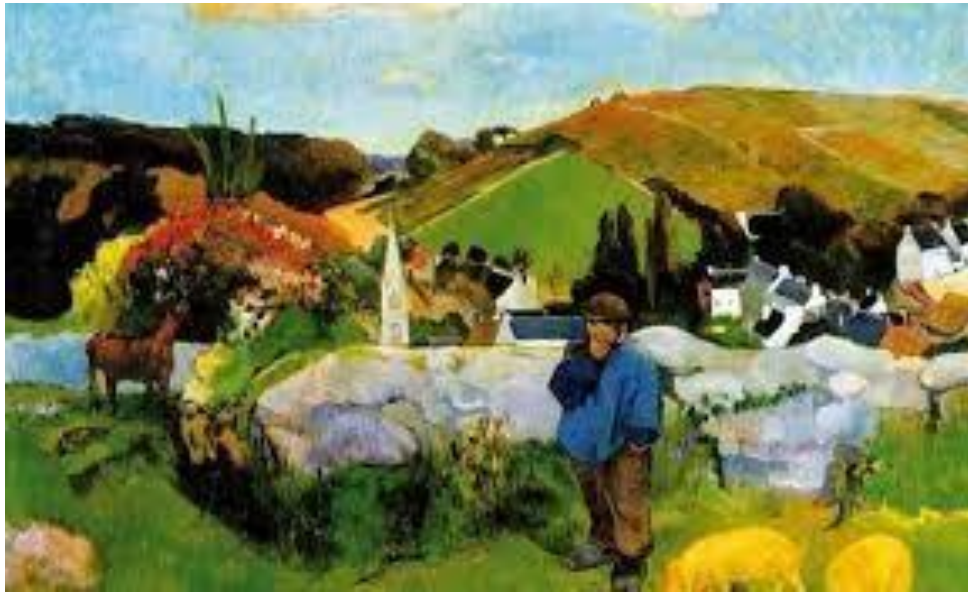
Immagini tratte dal web e utilizzate per finalità istituzionali

AZIENDA SANITARIA LOCALE RIETI Via del Terminillo, 42 – 02100 RIETI – Tel. 0746 2781 Codice Fiscale e Partita IVA 00821180577 PEC: dipartimento prevenzione.asl.rieti@pec.it Servizi Veterinari